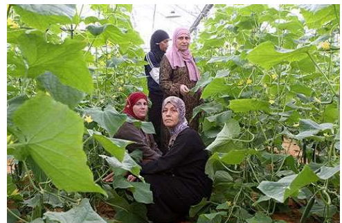
מוסף חממה תעסוקת נשים במגזר הערבי פועלות ערביות מ בקה אל ערבייה

מהסקירה עולה שמחירי הדירות ממשיכים להתייקר בקצב מהיר יותר משכר הדירה ובכך נמשכת הירידה בתשואה לבעלות על דירה. לפי הנתונים, מאז 2005 התייקרו מחירי הדירות ריאליית ב-100% בעוד מחירי השכירות התייקרו ב-18% בלבד. התוצאה היא שהתשואה על דירות ירדה מ-4% ב-2008 לפחות מ-1% ב-2017. לכן נראה שההתייקרויות האחרונות במחירי הדירור מגלמות בעיקר את ציפיות משקי הבית והמשקיעים לעליות מחירים נוספות בעתיד, הן במחירי הדירות הן בשכר הדירה הממוצע.