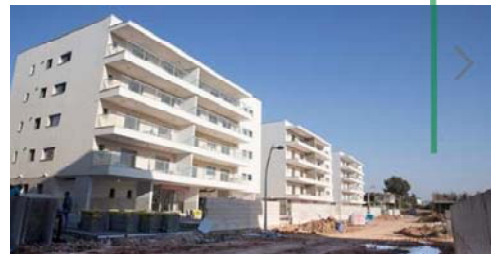
דירות מחיר למשתכן ב עפולה